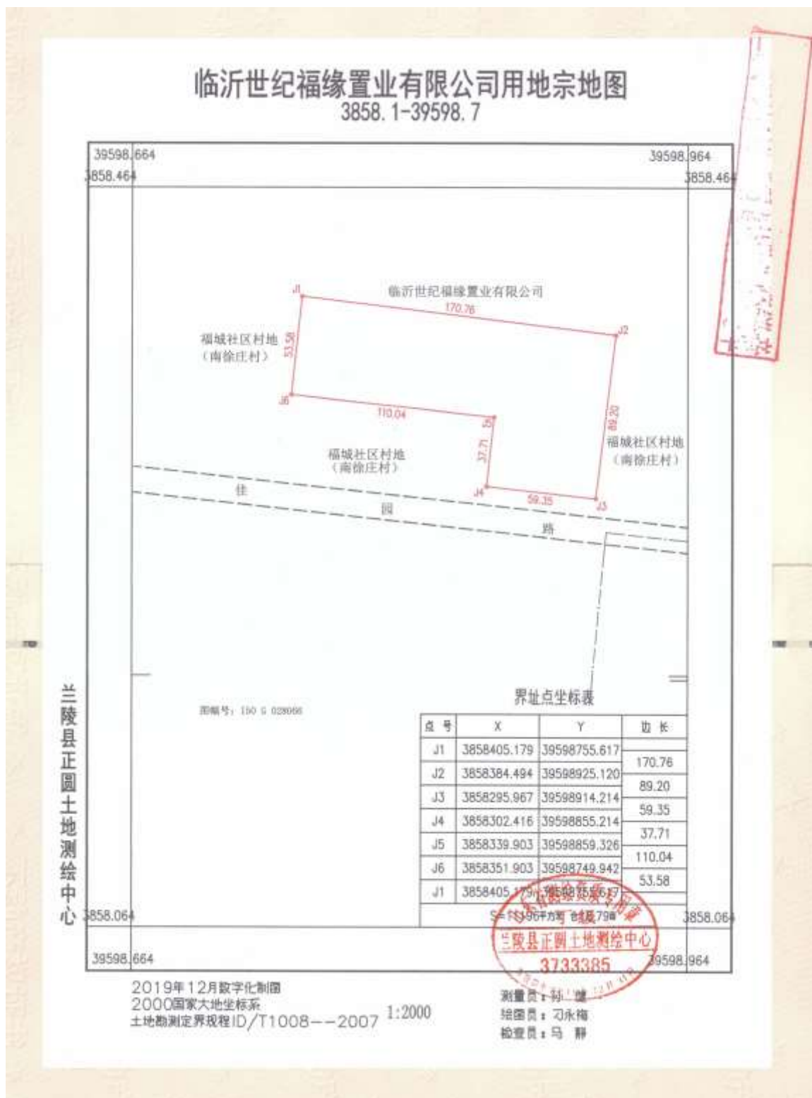
图 2.1-1 地块四至范围图