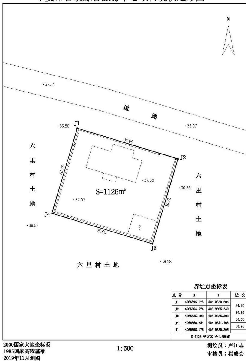
平度市古岷综合服务中心项目现状地形图