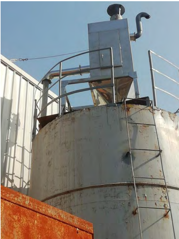
水泥料仓布袋除尘器